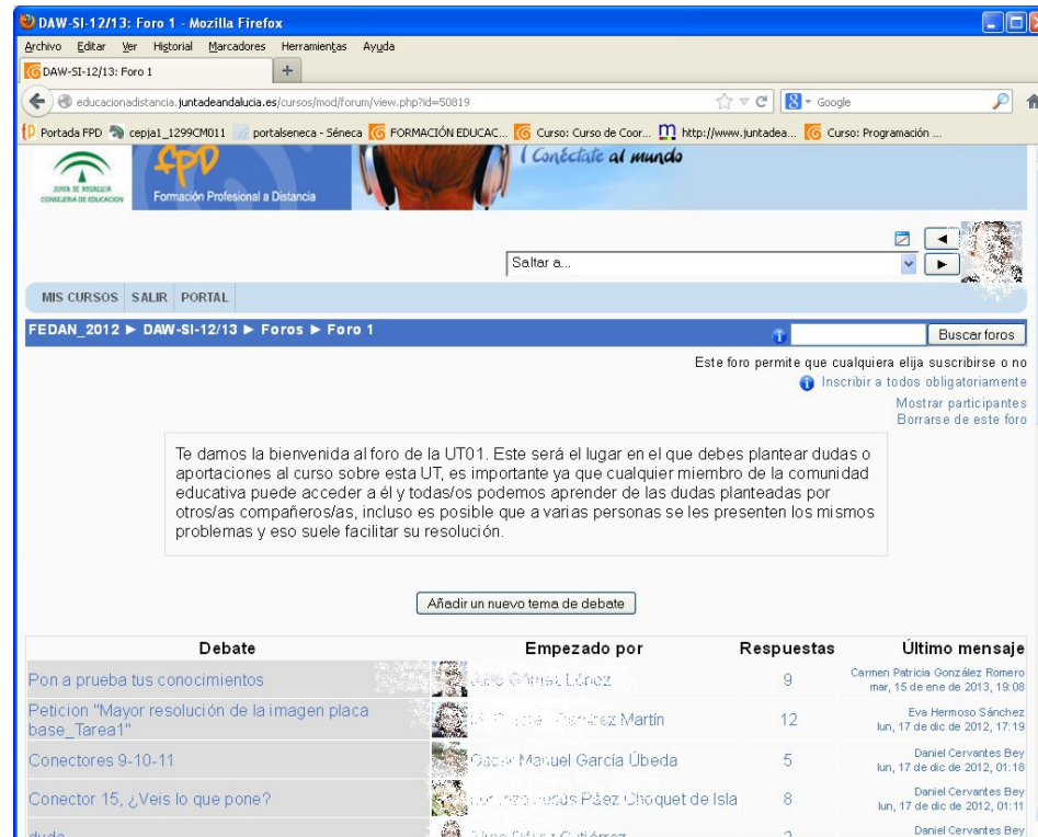
Captura de pantalla de la plataforma de FPAD

Para valorar la participación del alumnado en el foro, éste criterio se dejará a la opinión del profesor o profesora que imparte el módulo profesional. De cualquier forma, y con carácter general, se valorará las aportaciones que se hagan en el foro y que sean de utilidad para el resto de alumnos/as (tanto respuestas correctas como preguntas “interesantes”), se valorará la participación colaborativa.